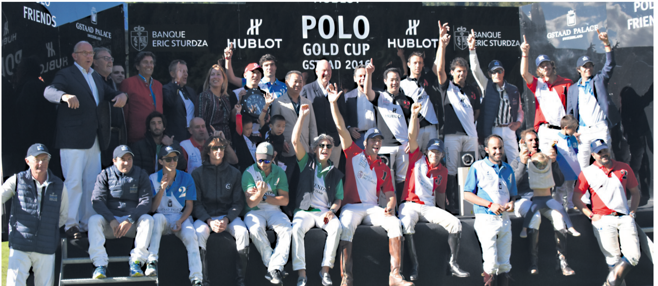
Die «Polo-Familie» 2016