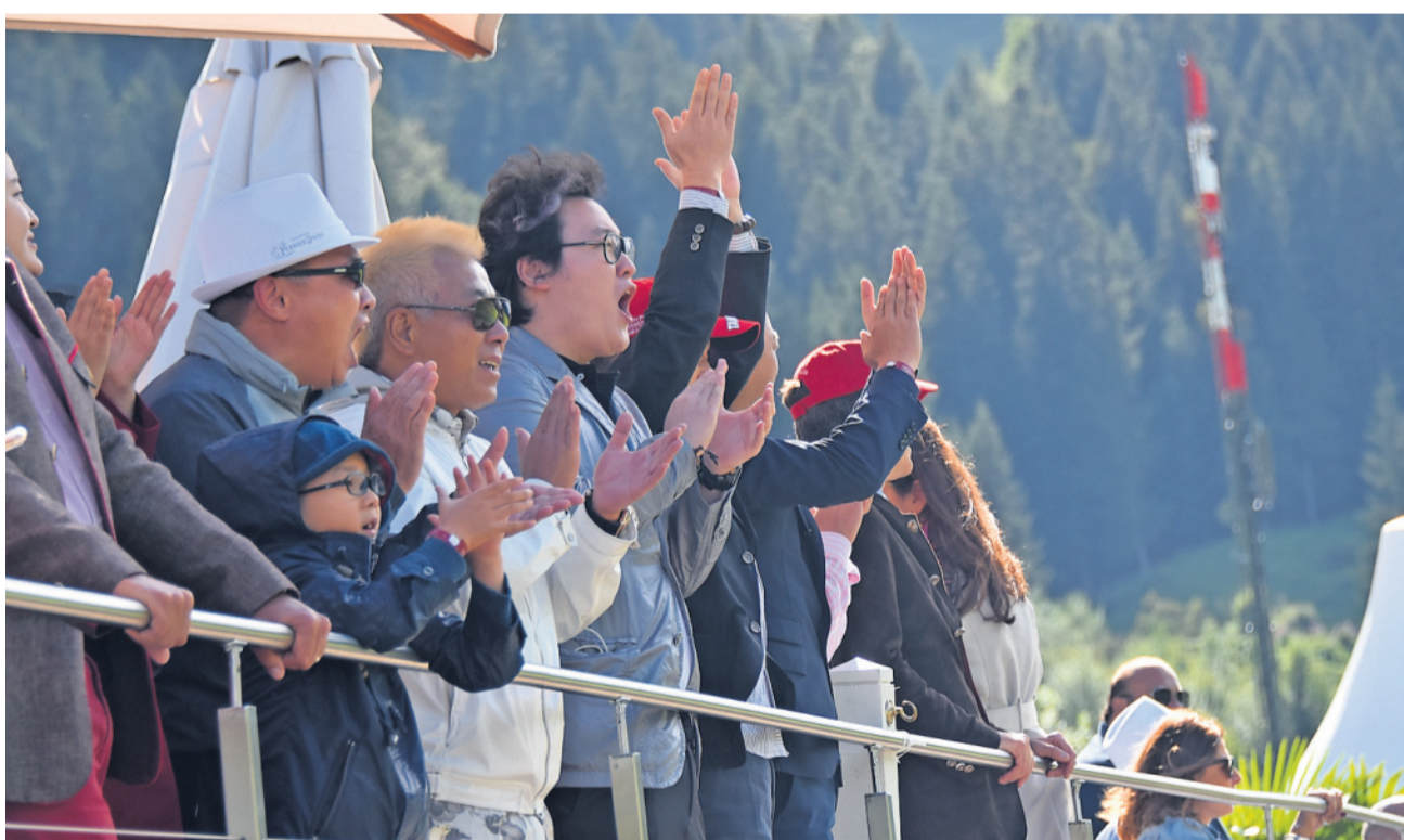
Die Gäste aus China freuen sich über den Sieg ihres Teams..