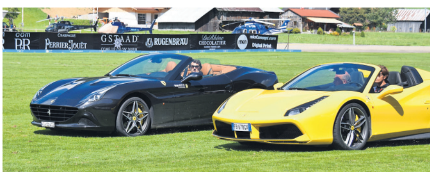
Der Matchball wird vorgefahren.