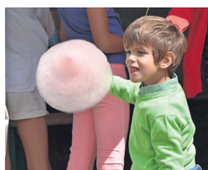
Auch Schleckmäuler kamen auf ihre Kosten.