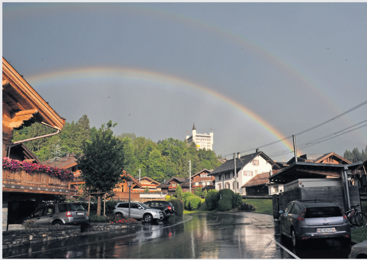
Besondere Stimmung nach dem Gewitter vom letzten Dienstag, 16. August

Schicken Sie uns Ihre Bilder an redaktion@anzeigervonsaanen.ch .