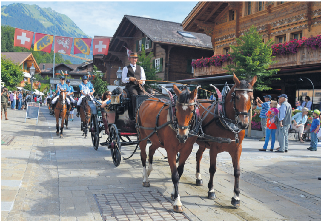
Bei strahlendem Sonnenschein fand am Freitag die Parade durch die Promenade statt.