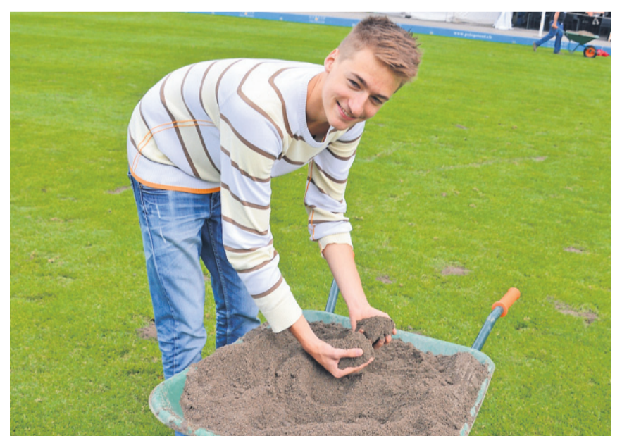
Der FC Sarina hilft jedes Jahr, die Löcher im Polorasen zu stopfen.