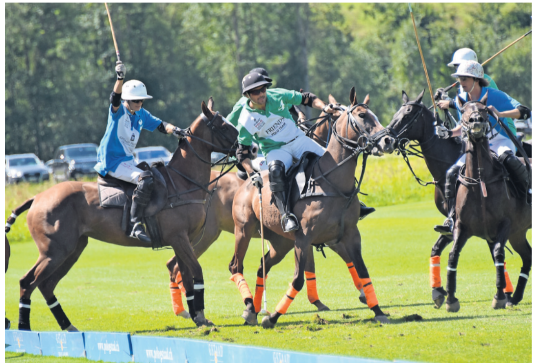
Das Team Gstaad Palace (in Blau) gewinnt dank Golden Goal das Spiel um Platz 3 gegen das Team Polo Friends.