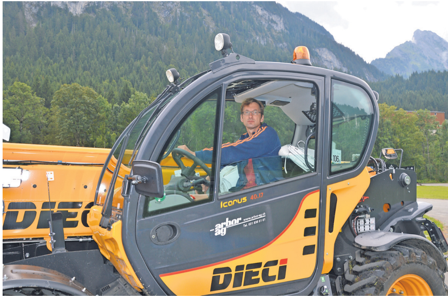
«Kacki» braucht den grossen Teleskop-Stapler für die schweren Materialien.

Haben Sie selbst Interesse am Polosport?