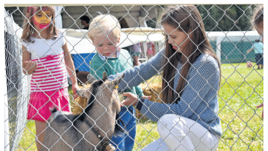
Im Streichelzoo hatte es Ziegen und Kaninchen.