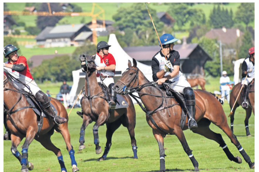
Die beiden Teams lieferten sich ein Kopf-an-Kopf-Finalspiel – mit dem besseren Ende für das Team Hublot (in Schwarz-Weiss).